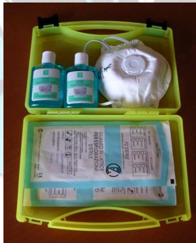
Kit PROLIFE (suministrado en paquetes de 24 unidades)

El kit PROLIFE es una pequeña caja plástica de color amarillo ( dimensiones: 244x184x46mm) con dos cierres, la cual contiene: