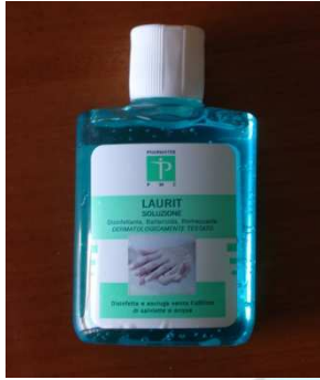
Botella de 80 ml. con tapa de rosca ( suministrado en paquetes de 12 unidades)