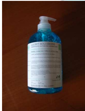
Botellas de 500 ml. con dispensador (suministrado en cajas de 24 unidades)